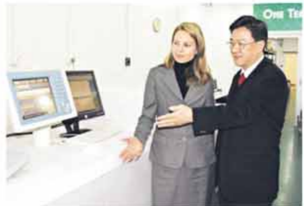
■NewspaperDirect、Icicle及佳能三方表示，今次合作為香港引進創新的世界報刊按需打印服務，正是「共生」經營哲學的一個實例。

最後順理成章，三者合作，Icicle成為Canon imagePRESS C7000VP在亞洲的其中一位領先用戶，利用該先進商用印刷設備，為香港引進NewspaperDirect按需打印服務。